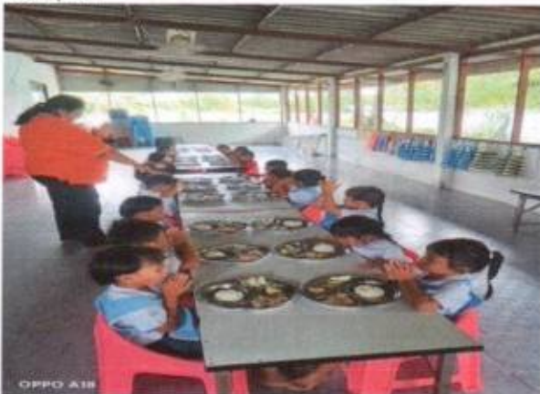
ศพค. วัดทรงศรี)