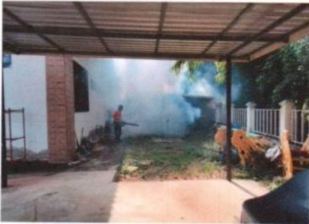
19.โครงการป้องกันและควบคุมโรคไข้เลือดออก