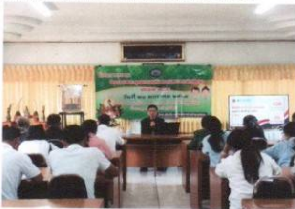
24.โครงการอบรมจิตอาสาและคุณธรรมจริยธรรมและธรรมาภิบาลประจำปี 68