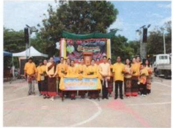
18.โครงการงานประเพณีวิถีอีสานสืบสานวัฒนธรรมไทย (สัปดาห์ 12 ของ 14)