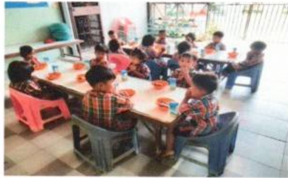
14. โครงการวันเด็กแห่งชาติ ประจำปี 2568